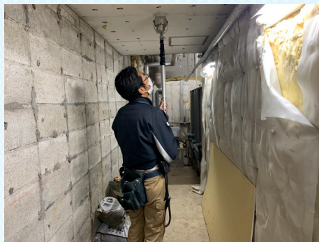
※2018年12月施工時の様子